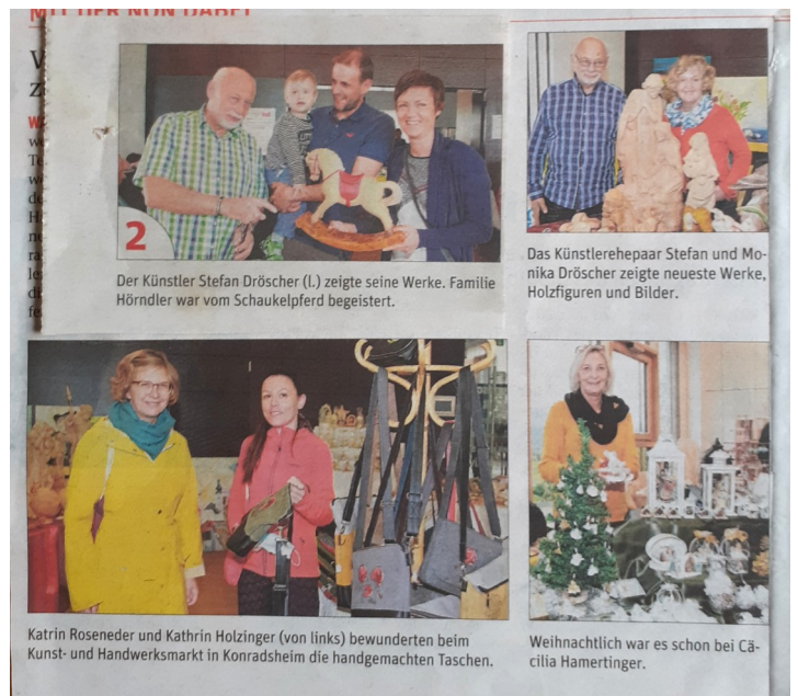
Presserückblick auf 10 Jahre Kunsthandwerksmarkt in Konradsheim

Anlässlich des Jubiläums wird eine Tombola veranstaltet, deren Erlös der Pfarre für die voriges Jahr neu gestarteten „Treffen für die ältere Generation“ zugute kommen soll. Wir danken sehr herzlich für diese Unterstützung.