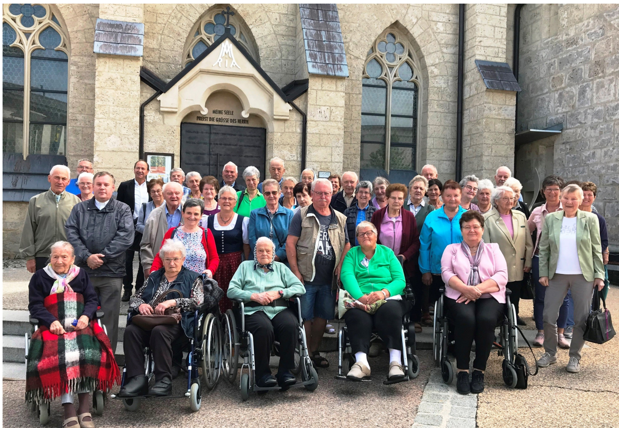
Im Sommer waren die älteren Pfarrangehörigen zu einer Wallfahrt nach Maria Neustift und zum gemeinsamen Mittagessen im Gasthaus Schaupp eingeladen.